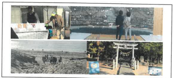
▲幸浦について考え学ぶことのできるイベントとなりました。